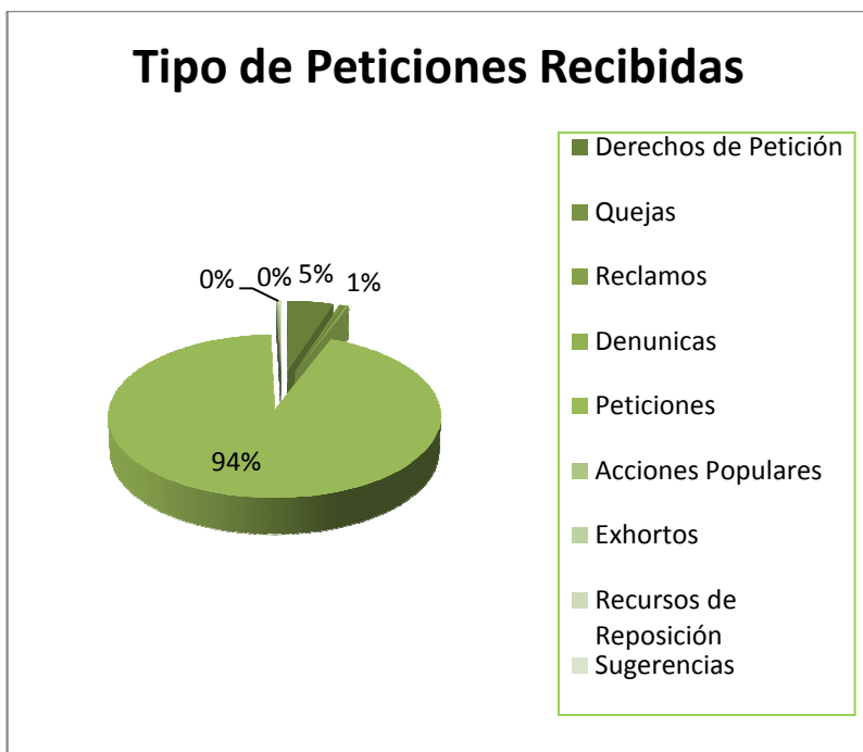
Gráfica nº 1